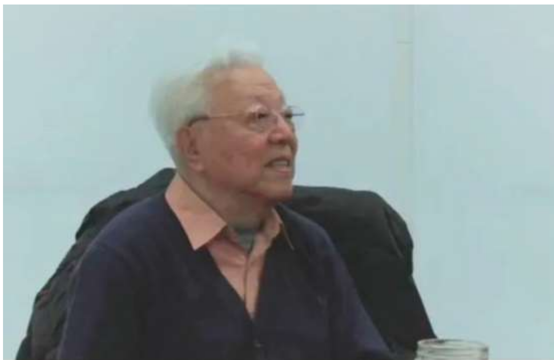
郑光美院士开幕式致辞