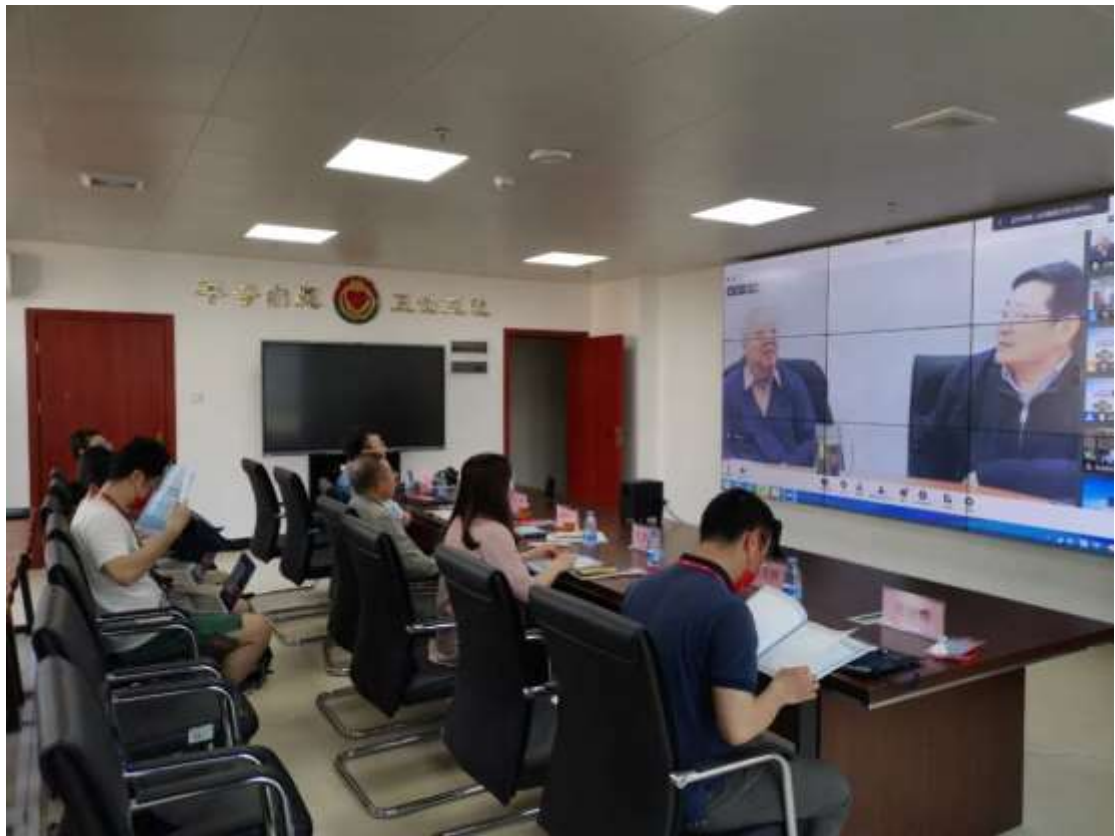
第十六届中国鸟类学大会开幕式