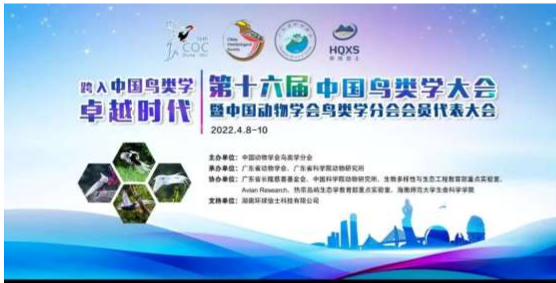
第十六届中国鸟类学大会暨会员代表大会