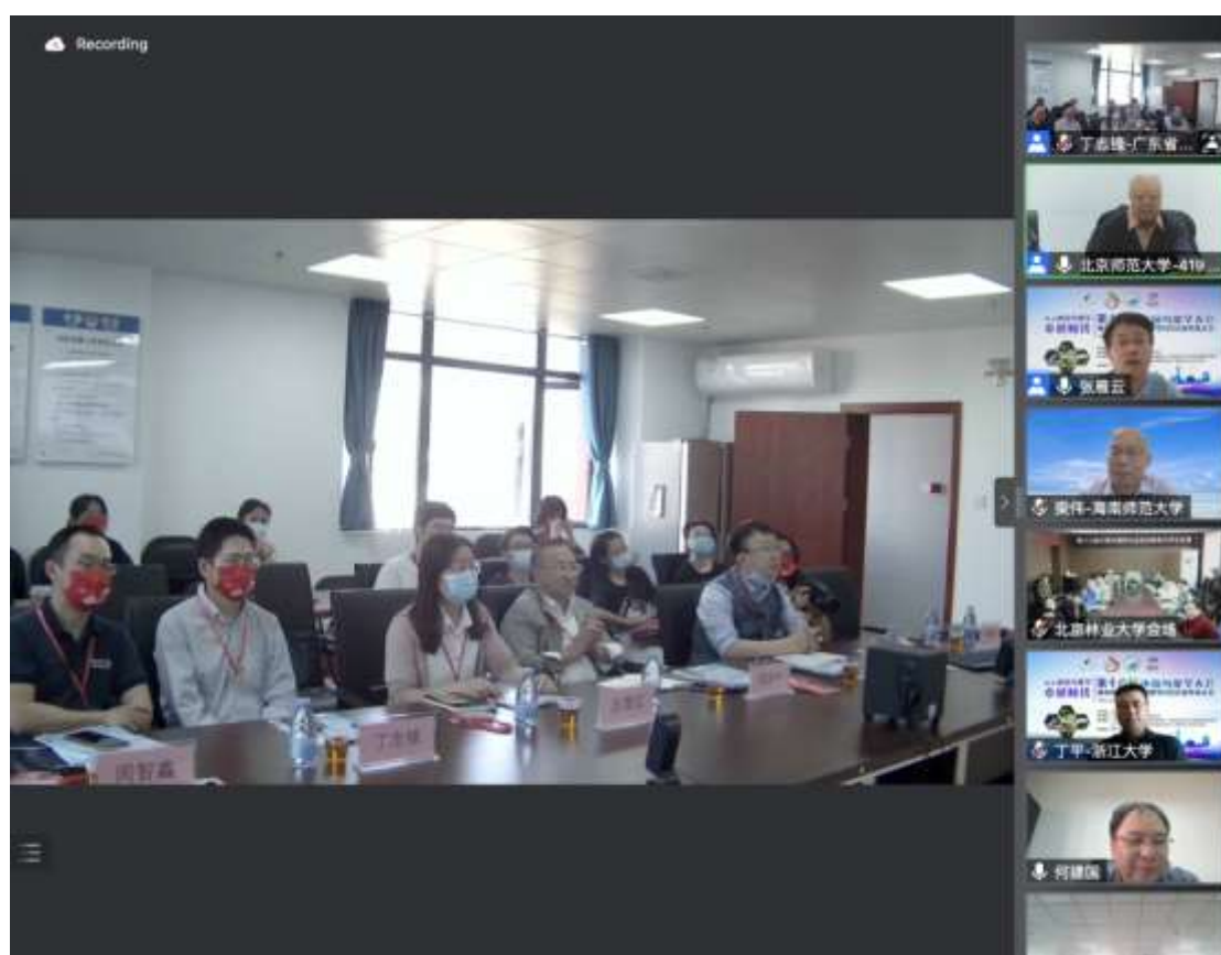
开幕式广州分会场