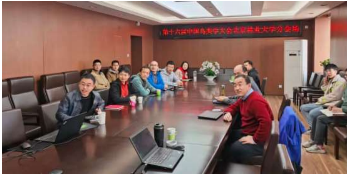
开幕式北京林业大学分会场

本次大会的主题是“跨入中国鸟类学卓越时代”，会议围绕鸟类生态学、行为学、保护生物学、保护遗传学、基因组学以及方法学等领域进行了深入讨论和交流。